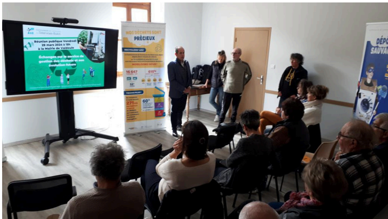
*Communauté de communes du Sisteronais Buëch

Rappel : tous les emballages sont recyclables et doivent être déposés dans le conteneur à couvercle jaune. Ils doivent être auparavant totalement vidés de leur contenu. Il n'est pas demandé de les laver.