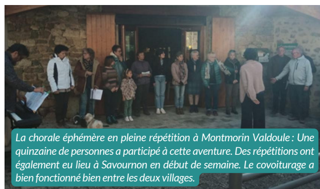
La chorale éphémère en pleine répétition à Montmorin Valdoule : Une quinzaine de personnes a participé à cette aventure. Des répétitions ont également eu lieu à Savournon en début de semaine. Le covoiturage a bien fonctionné bien entre les deux villages.