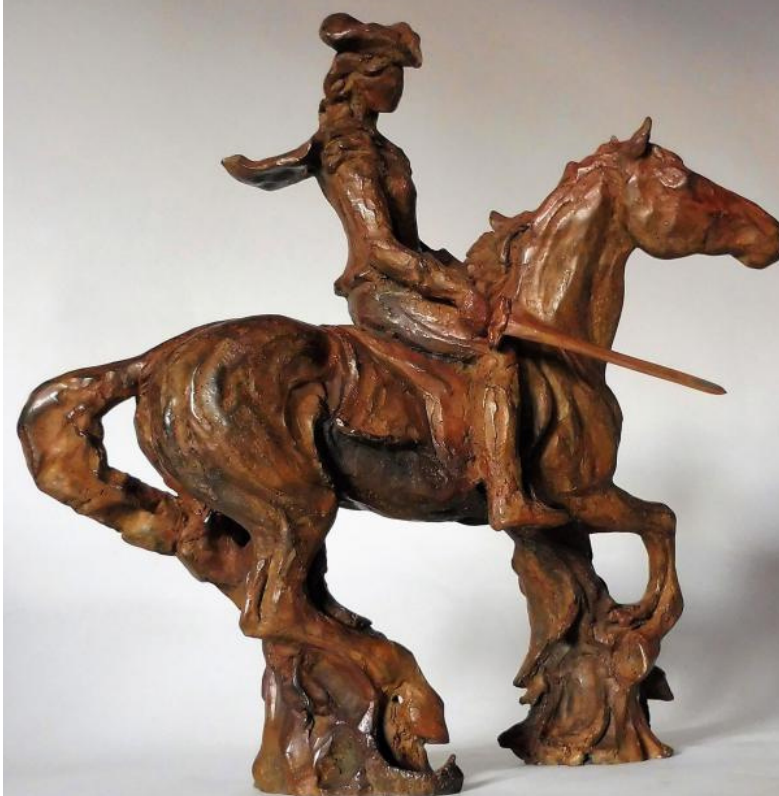
Philis de La Tour du Pin La Charce - Bronze par Alexia Carr - 2020