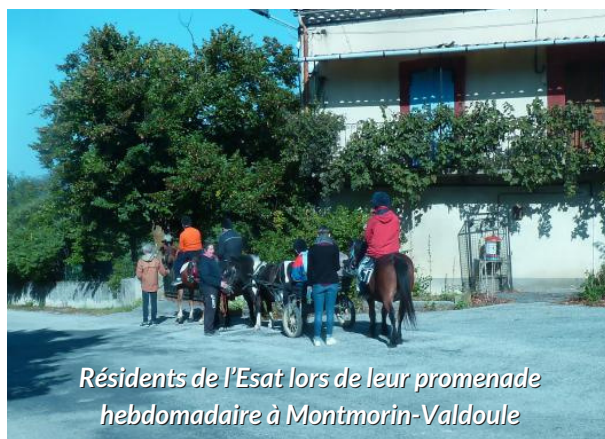
Résidents de l'Esat lors de leur promenade hebdomadaire à Montmorin-Valdoule

- C'est pour moi une occasion de plus de transmettre ma passion pour les chevaux. On voit les effets de l'animal sur la personne. Après une séance, les participants sont plus posés, plus intéressés, avec moins de gestes stéréotypés. Tout est important : la chaleur de l'animal, le toucher, la relation non verbale, gestuelle et corporelle. Tout cela a un effet apaisant pour les participants qui repartent plus détendus. Quant à l'animal, il n'a pas d'apriori. »