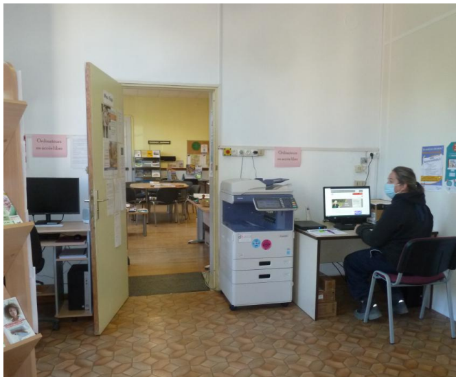
L'espace France Service de Valdoule

Le 1er octobre, la MSAP de Montmorin Valdoule a obtenu le nouveau label d'Espace France Service. Il fallait pour ce faire que cette structure réponde à un cahier des charges exigeant, ce à quoi se sont attelés élus et personnel relevant du Pôle Service à la population et aux communes, depuis plusieurs mois. Environ un an donc après ses « grandes sœurs » de Serres, Laragne et Rosans, la petite MSAP de Valdoule (mais aussi celle de Sisteron) obtient ce nouveau label, d'envergure nationale avec à la clé la pérennisation des financements de la part de l'Etat (FNADT) et des partenaires que sont : Pôle Emploi, la CAF, la CPAM, la MSA, l'Assurance retraite, le Ministère de l'Intérieur, le ministère de la Justice, le Ministère des Finances et la Poste.