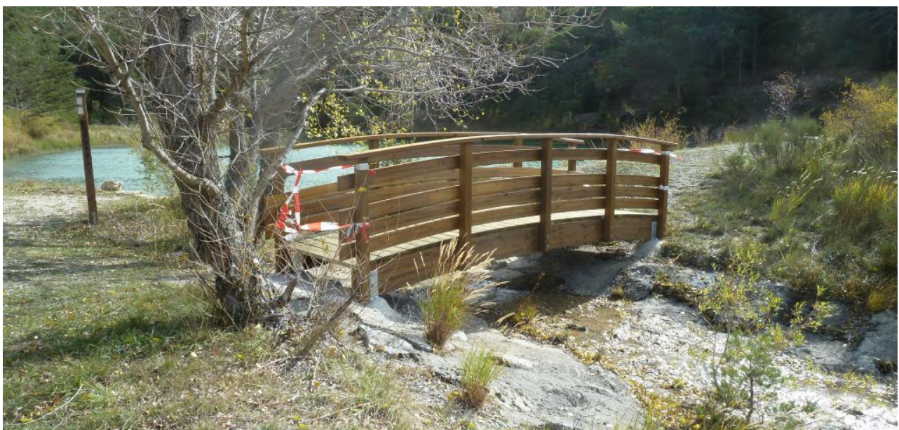
Passerelle en bois

Les travaux, réalisés par l'entreprise Aubépart TP, ont été financés par le Département et par l'État (DETR).