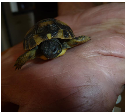
Une tortue d'Hermann née à Valdoule