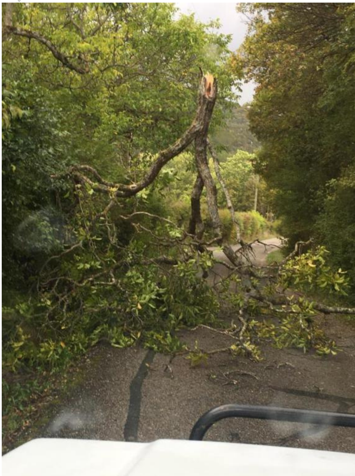
Quelques dégâts suite à la tempête du 2 octobre sur le chemin de Chatusse (Montmorin)