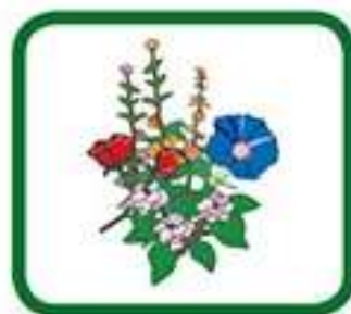
plantes, végétaux flétris