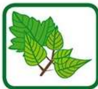
feuilles, taille de végétaux