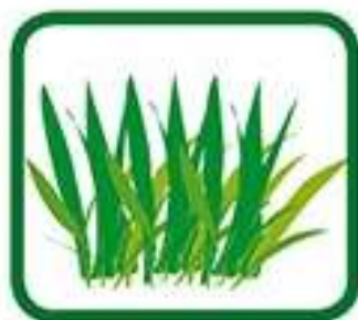
tontes de gazon