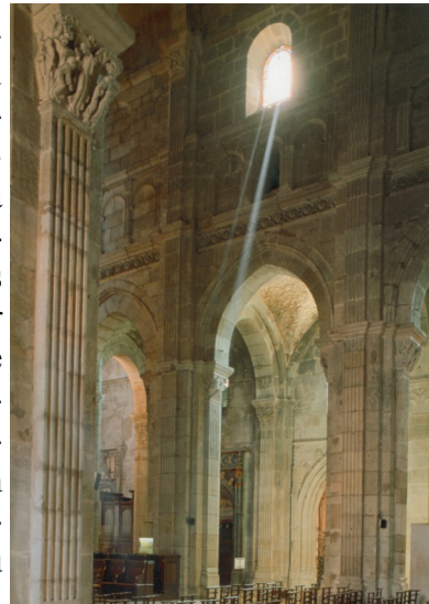
Cathédrale St Lazare à Autun