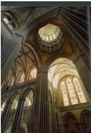
Cathédrale de Coutances