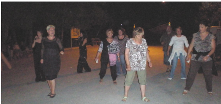
Le quart d'heure « Maddison » que tout le monde attendait

Toujours aussi sympathique : la fête votive de Montmorin a eu lieu le premier week end du mois d'août. Au beau milieu du chassé croisé entre aoûtien à peine arrivés et juilletistes sur le départ, la fête de Montmorin parvient cette année encore à tirer son épingle du jeu, de quoi encourager les membres du comité des fêtes, imperturbables et toujours motivés quoi qu'il arrive.