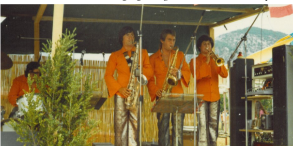
Les Radiations dans les années 70