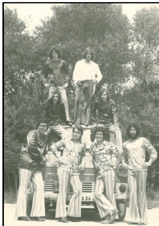
Les Radiations en 1971

Encore bravo au comité des fêtes, aux bénévoles, à Miss frite... grâce à qui la fête votive de Montmorin revient chaque année animer la place du 19 mars invariablement le premier week end du mois d'août. Forcément un peu éclipsée par d'autres fêtes qui ont lieu le même jour, c'est inévitable, la fête de Montmorin, si elle n'existait plus, il y a fort à parier qu'elle nous manquerait, à tous !