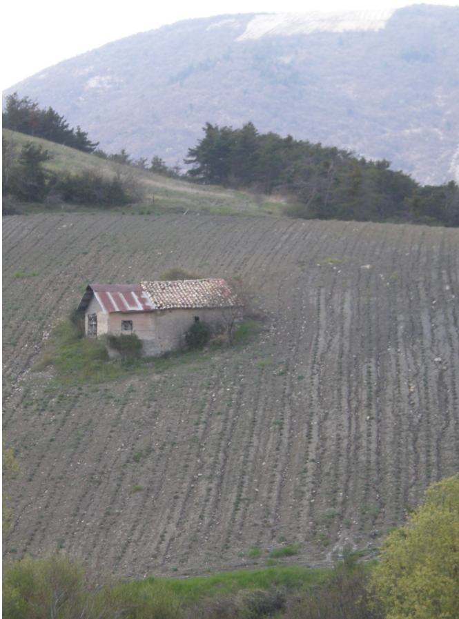
Sur la route du Verrier : le cabanon de Julien Corréard servait autrefois de bergerie

....A Sainte-Marie, sur la route du Verrier en direction de Pommerol, en dessous du relais télé, un cabanon s'impose au beau milieu