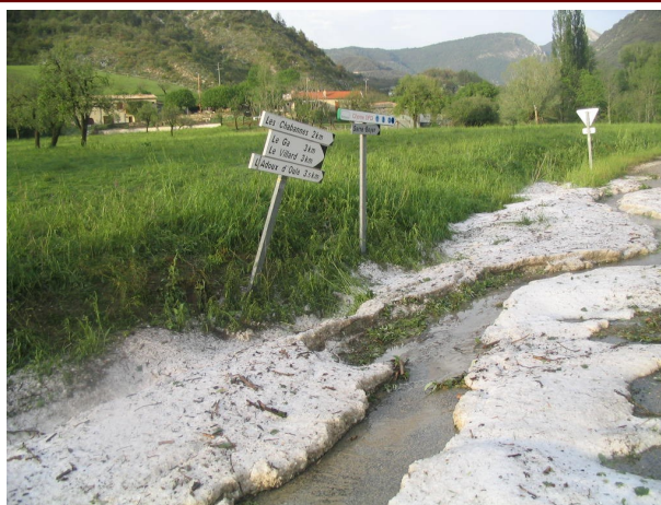
La D 26 photographiée juste après l'orage