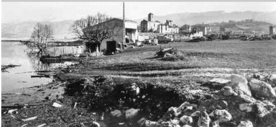
Les Salles sur Verdon « les pieds dans l'eau » (février 1974)

bonne journée d'autant que dans le car l'ambiance était formidable », tel fut le mot de la fin exprimé par tous les participants au terme de cette journée totalement réussie malgré la météo un peu instable de ces jours-ci.