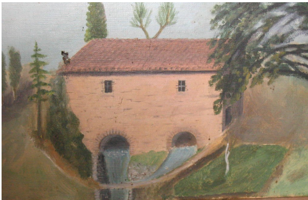
Reproduction du moulin Cairot réalisée par Monsieur Dultier, propriétaire du château du bas du village de 1780 à 1903

Il faut savoir en effet qu'il existait dans ce même quartier, environ 50 m en amont et sur la rive gauche un moulin appelé « le moulin vieux » dont la prise sur l'Oule se situait au quartier dit justement « de la prise » non loin de la maison Conchy. De ce moulin-ci, tout comme le moulin vieux d'Usage à Bruis, ne reste aujourd'hui qu'un « clapier », c'est-à-dire un tas de pierres.