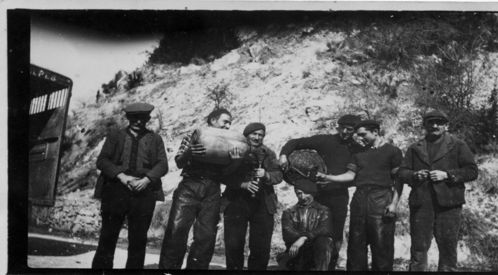
A Montmorin, juste à côté de la scie : l'huile vient d'être mise en bonbonne : c'est un petit évènement !

lisé (jusqu'en 1952) pour la fabrication de l'huile de noix grâce à une meule et un pressoir achetés à Poyol dans la Drôme. A noter que ce pressoir se trouve exposé dans « l'Ecurie Casado » de Montmorin. Le système est performant et à cette époque on vient d'assez loin pour faire son huile : de St André de Rosans, de Montjay,.... Et une fois sur place, on en profite même pour improviser des repas copieux et bien typiques de ce terroir, composés de saucisses cuites dans la pâte de noix.... « à la bonne franquette bien sûr ! »