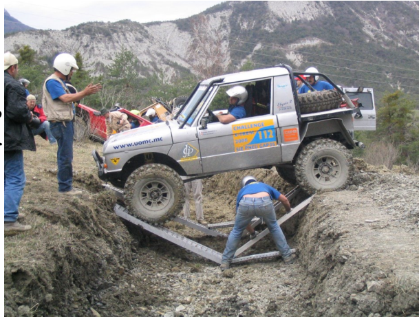
Franchissement de la tranchée : une performance technique de haut niveau.

cas de blocage total des véhicules, les co pilotes ont recours au tractage à l'aide de treuils.