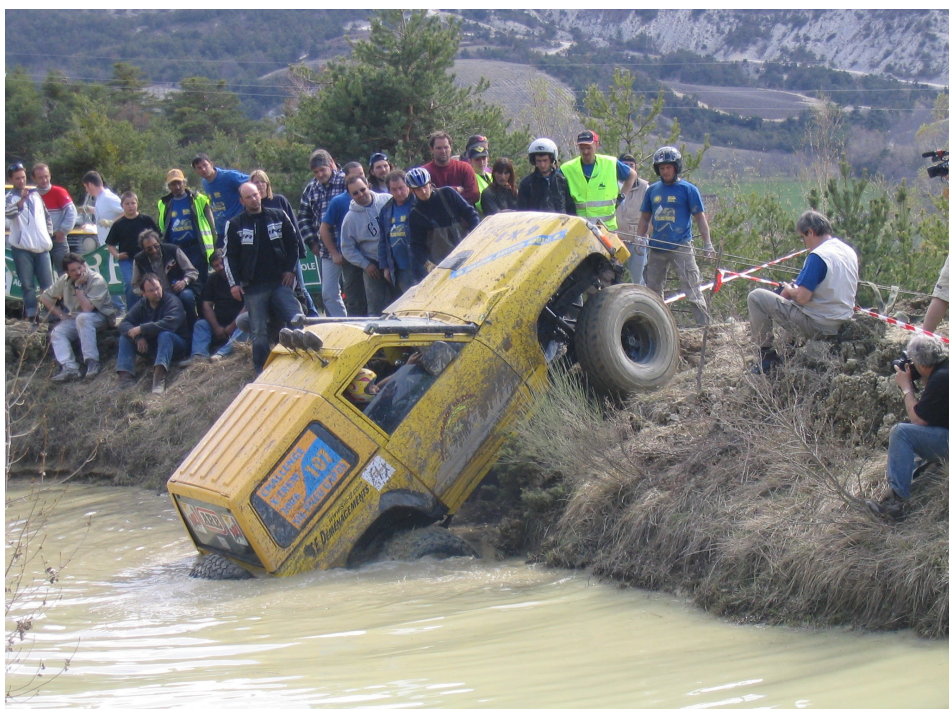
De la « marre aux canards » il faut sortir !!!