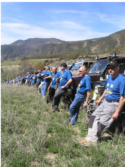
Les 16 concurrents au départ : T-shirts encore flambant neuf !... Pas pour longtemps ! A vos marques, prêts, roulez !!!

au Berlin-Breslaw, Rainforest... L'EXTREM Challenge Aventure sera aussi une occasion supplémentaire de faire connaître la Vallée de l'Oule ! »