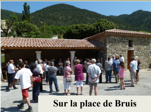
Sur la place de Bruis