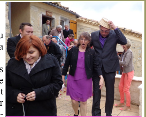
Avis de tempête ... de riz sur Sainte-Marie