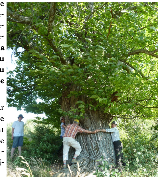
Situé près du relais au dessus de Ste-Marie, ce châtaignier se trouve en fait déjà dans la Drôme