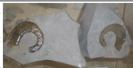
Ammonite et son empreinte en provenance de l'Infernet