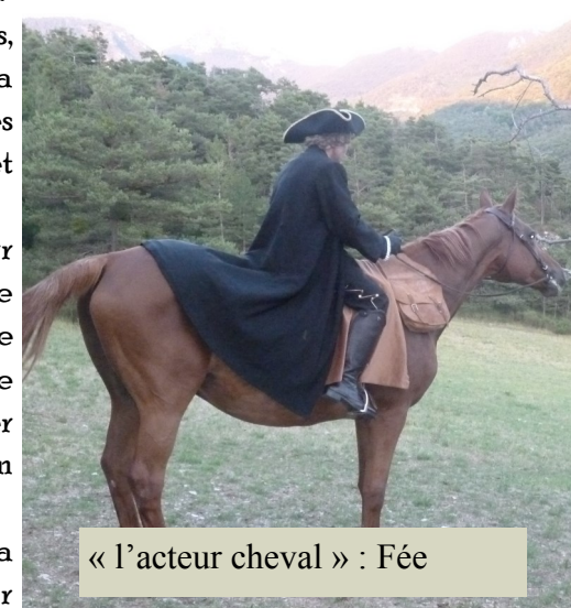
« l'acteur cheval » : Fée