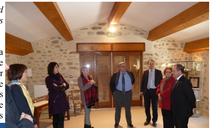
A Montmorin, Le Préfet a découvert l'exposition sur la première guerre mondiale

En réponse à ces inquiétudes, Monsieur le Préfet a rappelé aux maires les avantages d'une commune unique, à savoir, l'optimisation des moyens par leur mutualisation. Quant à l'aspect financier, le représentant de l'Etat n'est pas venu les mains vides et annonce que si les communes jouent le jeu, le manque à gagner évoqué sera compensé par des