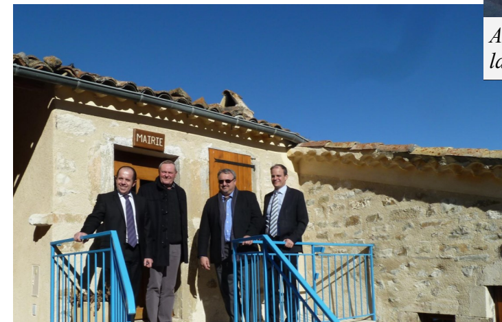
A Sainte-Marie : devant l'une des plus petites mairies de France et son maire...grand !

entre elles, le gouvernement ne reculera pas), la commune nouvelle aura un peu plus de poids."