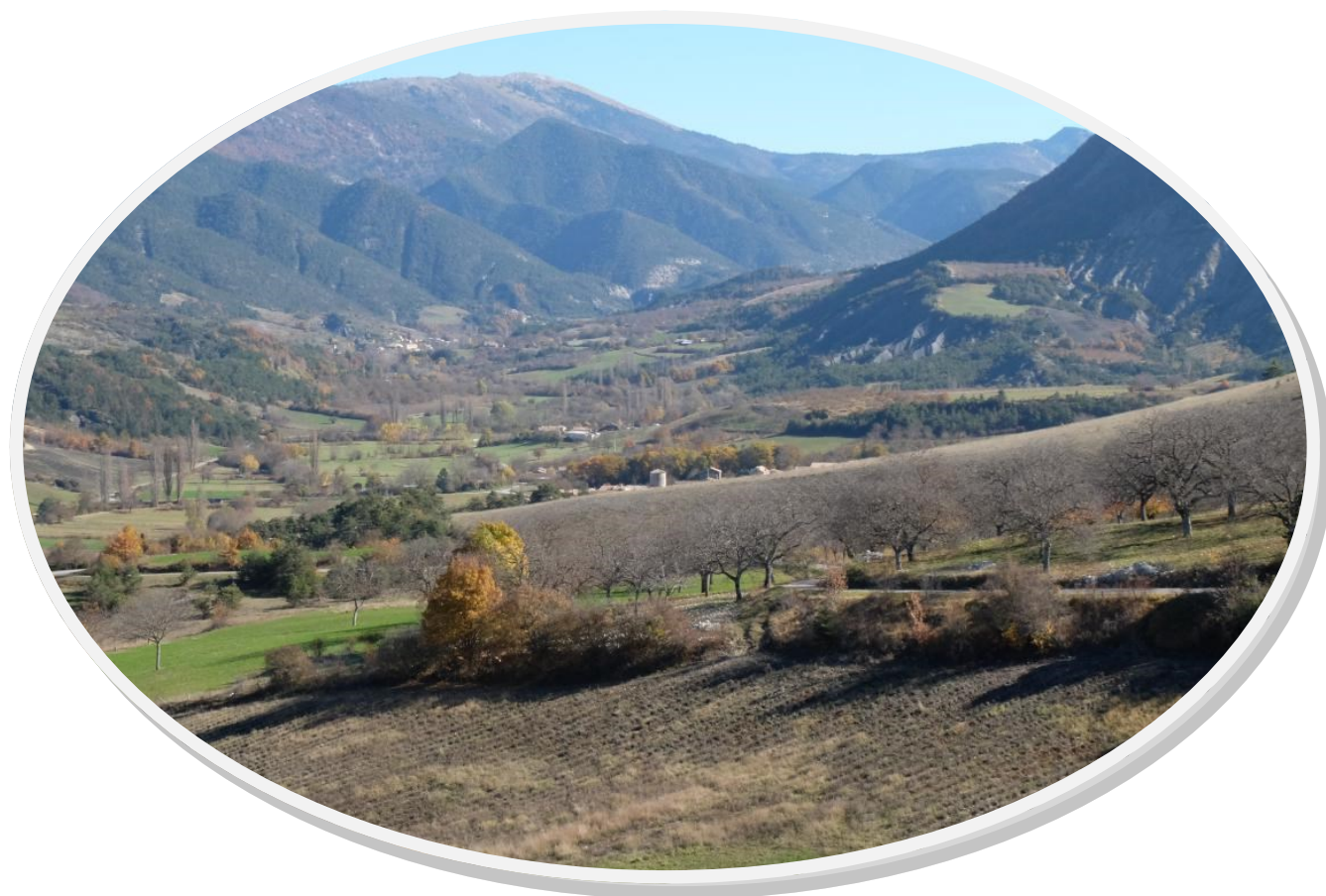
La vallée de l'Oule

Vous pourrez utiliser ce site, qui est en cours de construction, en vous connectant sur le lien http://valdoule.wordpress.com